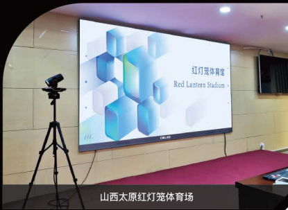
山西太原红灯笼体育场