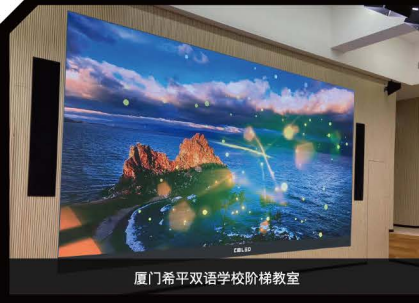
厦门希平双语学校阶梯教室