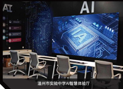
温州市实验中学AI智慧体验厅