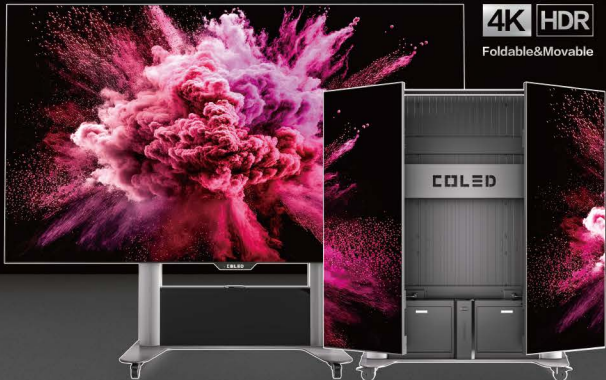
F-BOARD-A 自动折叠升降一体机

深圳市科伦特电子有限公司 SHENZHEN CLT ELECTRONICS CO.,LTD.