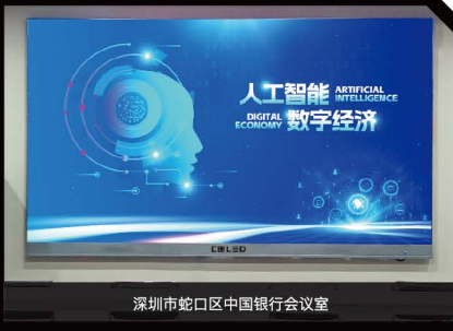
深圳市蛇口区中国银行会议室